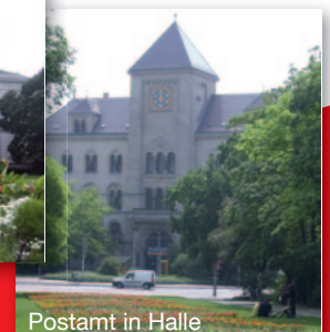
Postamt in Halle