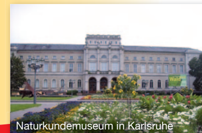
Naturkundemuseum in Karlsruhe

Die Stadtverwaltung Karlsruhe fördert den Austausch von Bürgerinnen und Bürgern beider Städte. Darüber hinaus unterstützt die Stadt Karlsruhe unseren Freundeskreis bei seiner Arbeit.